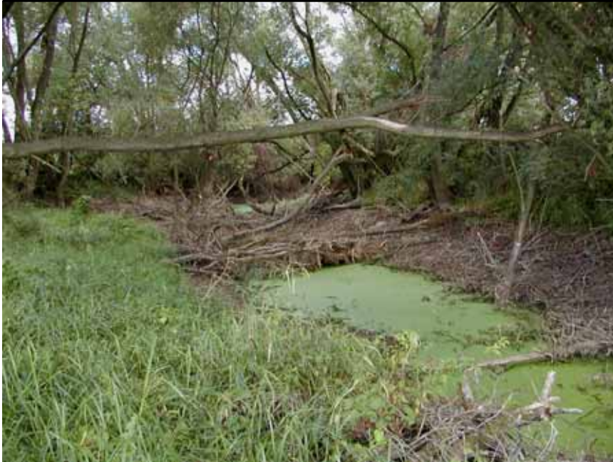
Altarm bei Rheden