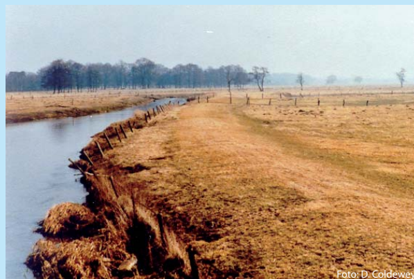
Abb. 2 Fehlende Gewässerrandstreifen und Uferabbrüche am Wümme-Nordarm im Jahr 1985