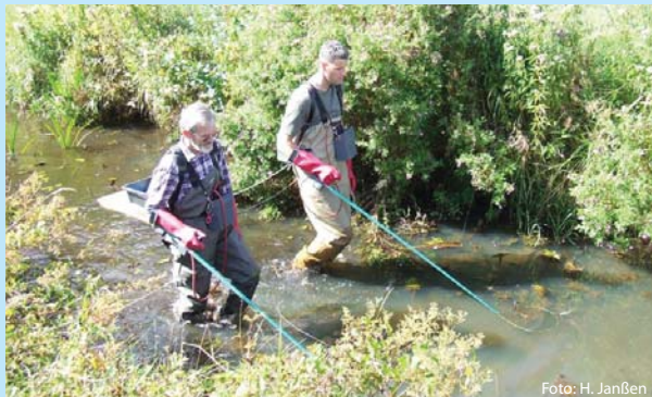
Abb. 9 Elektrofischung an der Großen Süderbäke

daher oft sinnvoll. Von Interesse ist dabei auch die Anzahl der Individuen je Art und deren Altersverteilung, da diese Informationen Rückschlüsse auf die Naturnähe des Gewässers zulassen (Abb. 9).