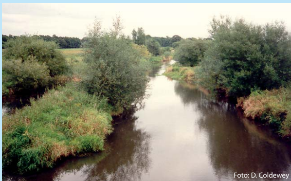
Abb. 3 Wümme-Nordarm nach Ausweisung des Gewässerrandstreifens 1991 und natürlicher Sukzession mit Erlen und Weiden im Jahr 1996

Die Anlage von Gewässerrandstreifen stellt eine Möglichkeit zur Lösung der genannten Defizite und zur Wiederherstellung der Funktionen im Übergangsbereich zwischen Gewässer und Landfläche dar. Neben der Filter- und Pufferfunktion (vor Nähr- und Schadstoffeinträgen) sowie dem natürlichen Erosions- bzw. Uferschutz durch das Wurzelwerk, zählt hierzu auch die Lebensraum- und Biotopverbundfunktion für Flora und Fauna. Sie sind darüber hinaus notwendig, um eine naturnahe Eigenentwicklung der Fließgewässer zu ermöglichen, bereichern das Landschaftsbild und tragen damit auch zum Naherholungswert bei (Abb. 3) [1, 2].