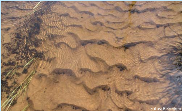
Abb. 6 Übersandete Gewässersohle: Keine Chance für Lachs, Forelle & Co.

Sandfrachten stellen kieslaichende Fische und die auf und in der Gewässersohle lebenden, wirbellosen 2 Tiere vor unlösbare Probleme. Weil der Sand die zur Fortpflanzung notwendigen Kiesbänke überdeckt, können sie sich hier nicht mehr reproduzieren. Ggf. vorhandene Fischbrut droht durch die Übersandung zu ersticken. Auch für die Wirbellosen, die Fischen als Nahrung dienen, wirkt das künstlich geschaffene „Sandstrahlgebläse“ lebensfeindlich [4]. Viele Arten sterben daher lokal aus, was sich negativ auf die Erreichung des guten ökologischen Zustands bzw. Potenzials auswirkt (Abb. 6).