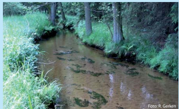
Abb. 5 Unnatürlich hohe Sandfrachten an einem Abschnitt der Fintau

Werden Fließgewässer „hart“ unterhalten (Entfernen von Kiesbänken, Sturzbäumen, Ästen zwecks Gewährleistung des Wasserabflusses), gehen nicht nur die für Fi-