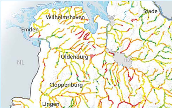
Abb. 8 Ausschnitt einer Detailstrukturkarte

daher oft sinnvoll. Von Interesse ist dabei auch die Anzahl der Individuen je Art und deren Altersverteilung, da diese Informationen Rückschlüsse auf die Naturnähe des Gewässers zulassen (Abb. 9).