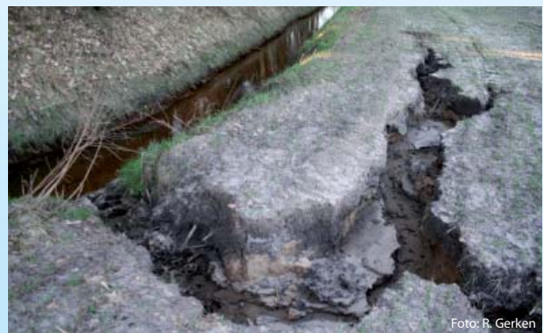
Abb. 4 Erosionsrinnen an einem Ackerstandort am Rieper Reithbach

nungssicherheit, ist mittelfristig mit einem verminderten Aufwand bei der Gewässerunterhaltung und finanziellen Einsparungen zu rechnen. Zudem können Landverluste durch Uferabbrüche und damit verbundene Einträge in die Gewässer deutlich reduziert werden (Abb. 4).