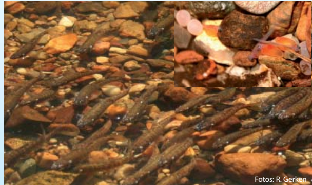
Abb. 7 Laichende Elritzen auf einer neu angelegter Kiesbank am Lünzener Bruchbach